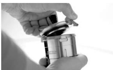
À VOS MARQUES

FRITSCH PULVERISETTE 7 premium line : la nouvelle référence pour l'obtention de poudres à l'échelle nanométrique !